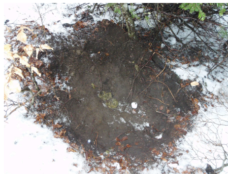
Couche d'ours