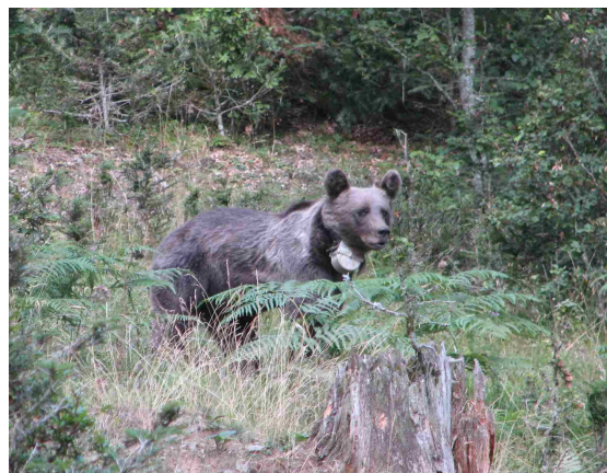
Palouma en 2006