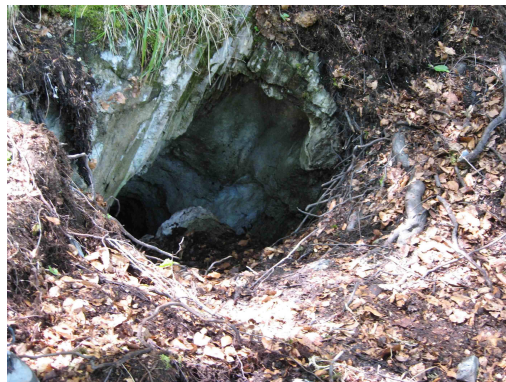
Tanière d'ours