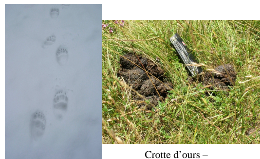
Crotte d'ours