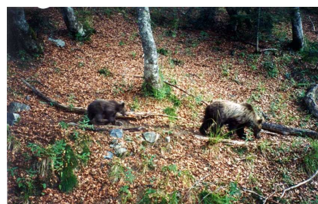
Cannelle et Pyren en 1995

Les femelles sont mûres vers 3 ou 4 ans et les mâles vers 4 ou 5 ans. La période du rut s'étale de mai à juin mais la gestation propre est repoussée à l'hiver où elle dure environ 2 mois. La femelle donne naissance en tanière à 2 ou 3 oursons tous les 2 à 3 ans en moyenne.