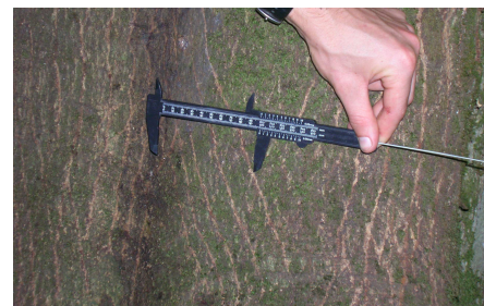
Griffades d'ours

Menaces et cause de régression : L'espèce a été chassée en France jusqu'en 1957. En 1962 les battues administratives sont interdites et l'espèce est protégée en 1981. Les primes liées à l'abattage d'un animal ont causé sa disparition du territoire et dès les années 30 seul le massif pyrénéen abrite encore une petite population. La modification du milieu montagnard, le petit nombre de femelles adultes vivantes dans les années 80 et 90 et la lente dynamique de population liée à l'espèce ont provoqué une chute des effectifs. Les mesures de protection ont tardé et le dernier ours brun disparaît des Pyrénées centrales à la fin des années 80. Il ne reste plus alors que 5 à 6 animaux dans les Pyrénées occidentales en 1995. La destruction directe d'animaux adultes et notamment de femelles lors d'actions de chasse (1994, 1997, 2004) ou d'accidents (2006, 2007) nuit beaucoup à la dynamique de la population.