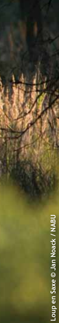
Loup en Saxe

croissance annuel de la population est assez important, de l'ordre de + 20 à + 30 %. Il est difficile d'évaluer ce que cela représente en surface... Quoiqu'il en soit, la colonisation se fait globalement de l'est, à partir des länder frontaliers de la Pologne (Saxe, Brandebourg) vers les länder du nord-ouest (Basse-Saxe, Schleswig-Holstein).