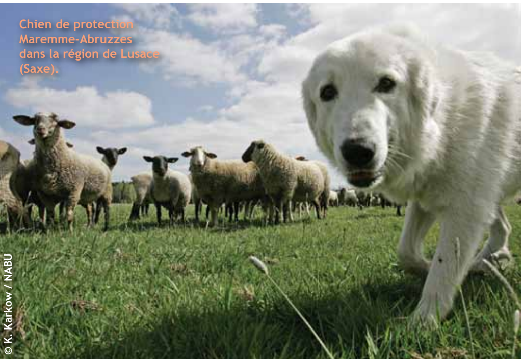
Chien de protection Maremma-Abruzzes dans la région de Lusace (Saxe).

Du côté des éleveurs et des chasseurs, c'est beaucoup plus compliqué. Pour les premiers, le loup reste une contrainte forte que les länder tentent de réduire, on en reparlera. Pour les seconds, la plus grande difficulté tient au fait que le loup est encore considéré comme un concurrent et une menace pour le gibier : soit parce qu'il le tue effectivement pour s'en nourrir, soit parce qu'il le fait fuir des territoires de chasse. Nous avons donc un effort à faire pour comprendre, scientifiquement, quel est l'impact réel du loup sur les populations d'ongulés. Comme je le disais, nous manquons de données sur