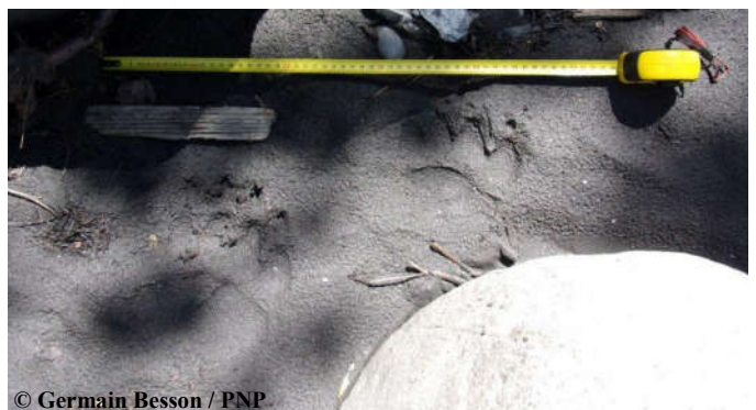
Empreintes d'un ours mâle indéterminé photographiées le 09 juillet 2016 sur la commune de St Lary Soulan (65).

Une sélection de photos et vidéos automatiques, classée par mois, est consultable sur notre site internet ONCFS ainsi que sur la chaîne Youtube ONCFS .