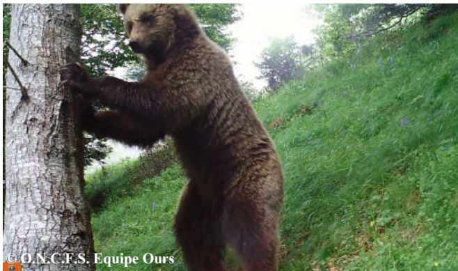
Photo d'un jeune mâle urinant au pied de l'arbre, extraite d'une vidéo automatique, réalisée le 06 juillet 2016 sur la commune de Sentein (09).