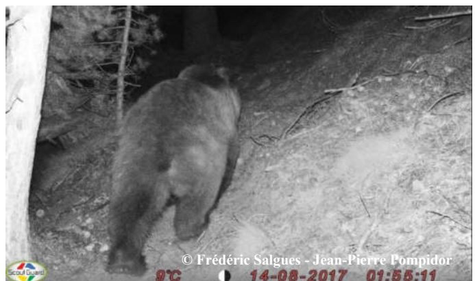
Photo automatique d'un ours indéterminé, le 14 août 2017 à 01h55, sur la commune de Fontrabieuse (66).

Une sélection de photos et vidéos automatiques, classée par mois, est consultable sur notre site internet ONCFS ainsi que sur la chaîne Youtube ONCFS .