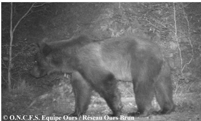
Photo automatique d'un ours indéterminé, le 15 août 2017 à 00h30, sur la commune d'Estaing (65).