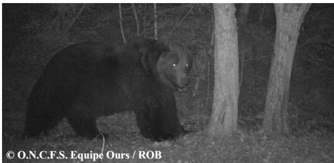
Photo automatique de l'ours Néré, le 25 octobre 2018 à 06h06, commune d'Estaing (65).