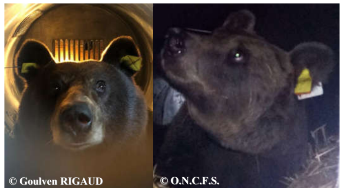
Photos des ourses Sorita (gauche) et Clavérina (droite), dans leur cage de transport, lors du voyage vers les Pyrénées françaises.

Une sélection de photos et vidéos automatiques, classée par mois, est consultable sur notre site internet ONCFS ainsi que sur la chaîne Youtube ONCFS .