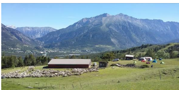
© FERUS- stage de sensibilisation 2017 - Enchastrayes

Cet espace de dialogue et d'ouverture , où chacun tient compte et respecte les prises de position de l'autre, permet de dépasser l'habituel clivage "pro-loup et anti-loup", pour œuvrer ensemble à la recherche et à l'application de solutions équitables et durables, préalable indispensable à toute coexistence apaisée.