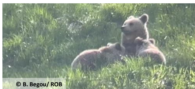
Photo issue d'une observation visuelle d'une ourse allaitant ses 2 subadultes le 3 juin 2025 à Bonac-Irazein (09).

Cette sélection d'images est consultable sur le portail de l'OFB .