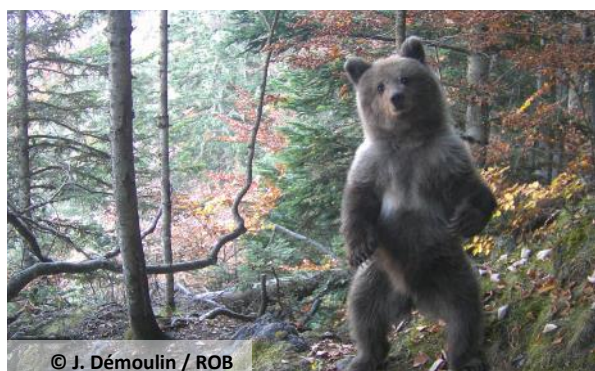
Photo automatique d'un ourson de l'année seul, le 16 octobre 2025, à Laruns (64).

Un total de 20 itinéraires ont permis de collecter 55 indices d'ours au cours de cette période. 24 caméras automatiques ont également permis de relever 91 séries de photos et vidéos dont la détection, à 13 reprises, d'un ourson isolé, sur la commune de Laruns (64), entre le 26 août et le 17 octobre (cf photo ci-dessous).