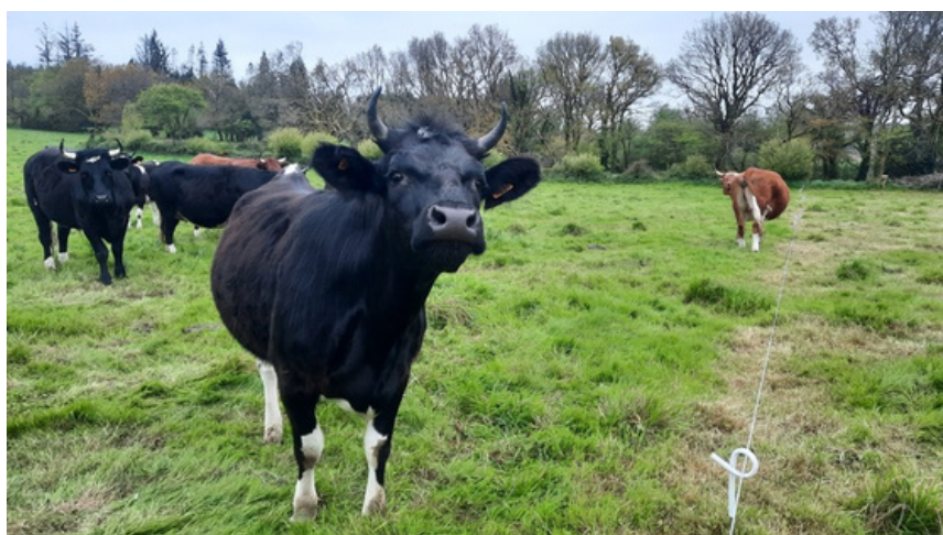
@ Tanguy Descamps